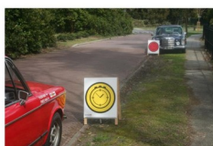
Bemande tijdcontrole, opstelling